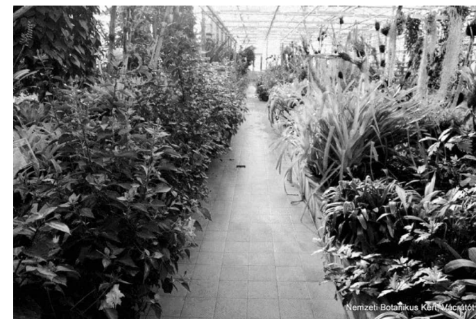
Orchidea- és broméliaház

Ökológiai Kutatóközpont Ökológiai és Botanikai Intézet 2163 Vácrátót, Alkotmány út 2-4. Telefon.: 28-360-122 E-mail: botanikuskert@okologia.mta.hu www.botanikuskert.hu www.okologia.mta.hu