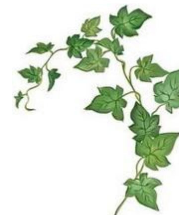
Közönséges borostyán (Hedera helix)